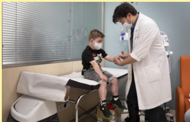
En el ensayo participarán 120 pacientes, de entre 4 y 7 años, de más de diez países

La teràpia busca suplir la manca de distrofina, proteïna essencial per al desenvolupament muscular i, frenar l'evolució d'aquesta malaltia degenerativa.